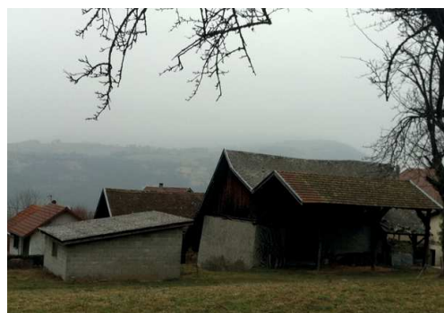
ÉTAT DES LIEUX EXISTANT